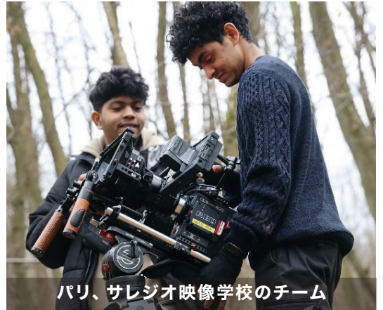
パリ、サレジオ映像学校のチーム

DBIMAで私たちが目指しているのは、質の高い動画の製作にとどまりません：若者自身に向けた内容を作りあげること、若者たちの心にゆだねます。学生の宗教的バックグラウンドがどうであれ、私たちはキリスト教的な価値観を育むという宣教的使命に根ざし、学生にカリエロLIFEのような課題に取り組んでもらいます。DBIMAでは、学生はメディアの働きを深く掘り下げて学び、道徳的、倫理的な原則を探究し語る手段として、映像制作を活かすのです。学生はこのプロジェクトを通して、宣教部門のアイデアからインスピレーションを受けて短い動画を製作します。宣教的使命を中心とするアプローチをもってメディア教育が行われ、人間的成長、内省、技術の向上が促進されるのです。