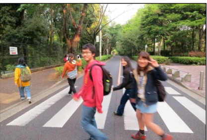
空も明るくなってきました。さあ、最終目的地へ！