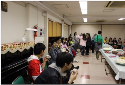
午前2時、杉並・イエスのカリタス修道女会に到着。おにぎり・おやつをいただきます！