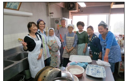
昼食を作ってくくださった、サレリアニ・ココペラトリーriの皆さん。おいしかったです！