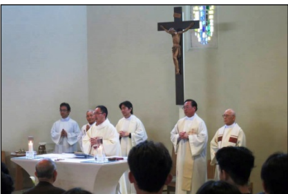
調布教会のミサで感謝をさげました。