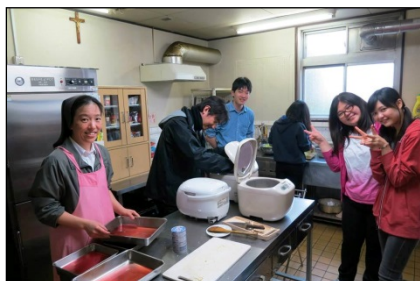
赤羽修学院で夕食作りからスタート。カレーライスでした♪

この企画を支えてくださった皆様のご協力と祈りに感謝します。今回の巡礼で灯った「ドン・ボスコの火」をきっかけにした、日本のサレジオ青年たちの次なるムーブメントに乞うご期待☆