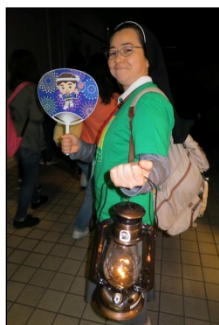
22:30、復活のろうそくからともされた「ドン・ボスコの火」を持って、さあ巡礼出発！