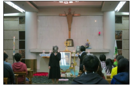
イエスのカリタス修道女会の成り立ちを、被養成者が寸劇で紹介。