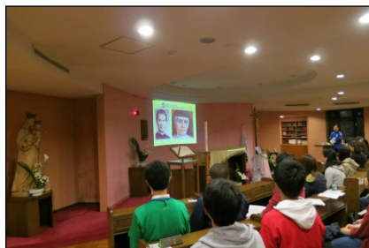
赤羽修学院の聖堂でサレジアン・シスターズの紹介。