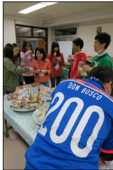
リポビタンD・オロナミンCで元気回復☆このユニフォームは…DON BOSCO 200?