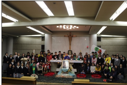
イエスのカリタス修道女会シスターたちと記念撮影☆