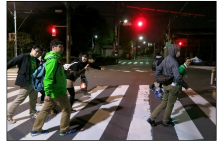
杉並を出て、目指すは…