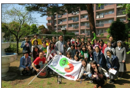
山野内管区長を囲んで記念撮影(^_^)/おつかれさまでした。