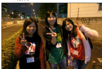
まだまだ余裕があります(^^)／