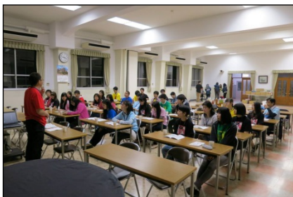
DB200周年、Salesian Youth Movement、総長から若者へのメッセージなどを学ぶ。