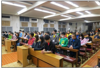
シスターたちは無事を願い、聖体の前で祈りを捧げていました。皆で聖体賛美式。