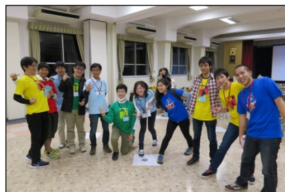
色とりどりのDB200記念Tシャツをみんなで着用☆