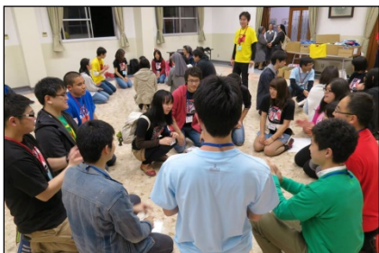
レクリエーションで打ち解けてきたかな？