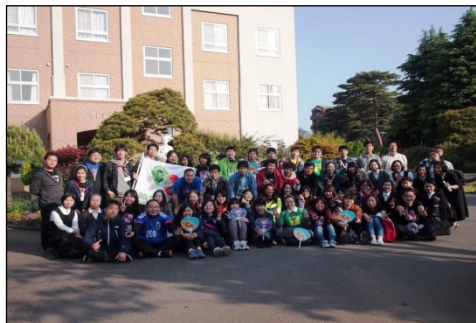
6:30 調布サレジオ神学院に無事到着☆