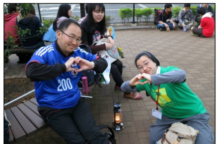
心もまだまだ元気！