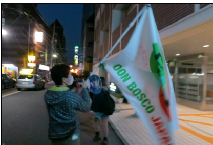
Don Bosco Japanの旗が街中をはためく。