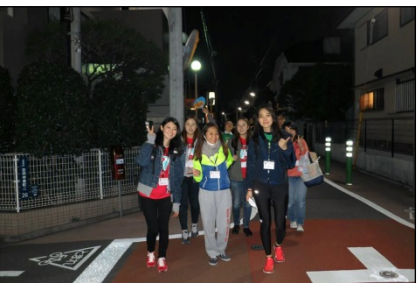
ずんずん。ワイワイ♪