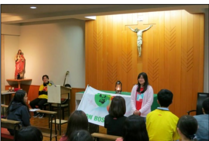
振り返ってみたことを分かち合いました。