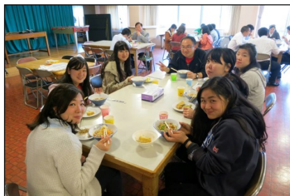
昼食は冷やしうどん☆